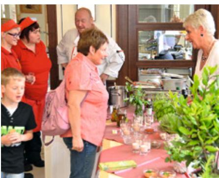
Die gesunde Ernährung im Fokus: Das Team der Firma Dussmann erläutern unterschiedliche Ernährungsformen.